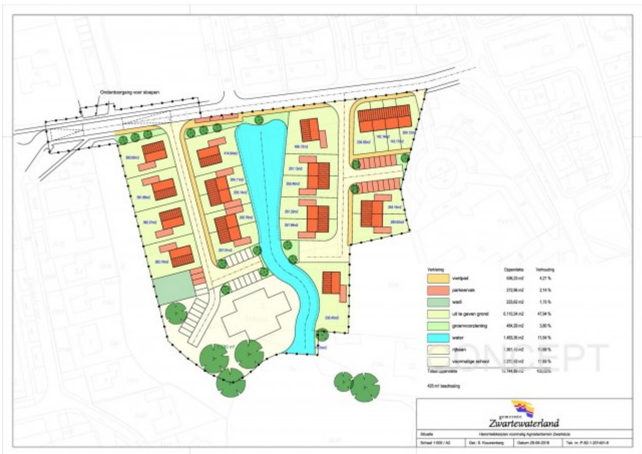
Afbeelding 1: Het plangebied voor de nieuwe woonwijk.

De inzet van de ChristenUnie is ook dat we kiezen voor een plan dat rekening houdt met het verleden van deze plek, waar zoveel mensen de middelbare school hebben doorlopen. Bovendien willen we een plan dat ervoor zorgt dat de nieuwe wijk een mooi onderdeel van Zwartsluis wordt. Daarbij is het belangrijk om goed te kijken naar de belevingswaarde voor de toekomstige bewoners van de woonwijk, maar ook voor de andere inwoners van Zwartsluis en de bezoekers van Zwartsluis. Wij vinden het belangrijk dat de nieuwe bebouwing zo wordt vormgegeven dat het mooi is om vanaf/over de kolk naar te kijken. Ook dat hebben we in ons amendement opgenomen. Op 23 maart zal besluitvorming plaatsvinden.